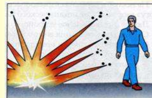
Опасная поза при взрыве